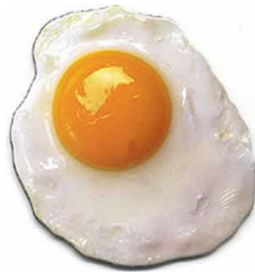
Huevo Frito Congelado. 45g

Horno: precalentar el horno a 200 ° C y calentar el producto durante 2 minutos Microondas: calentar a máxima potencia durante 45 segundos. Uso: calentar y comer como plato único o junto a otros alimentos, dependiendo de las preferencias del consumidor.